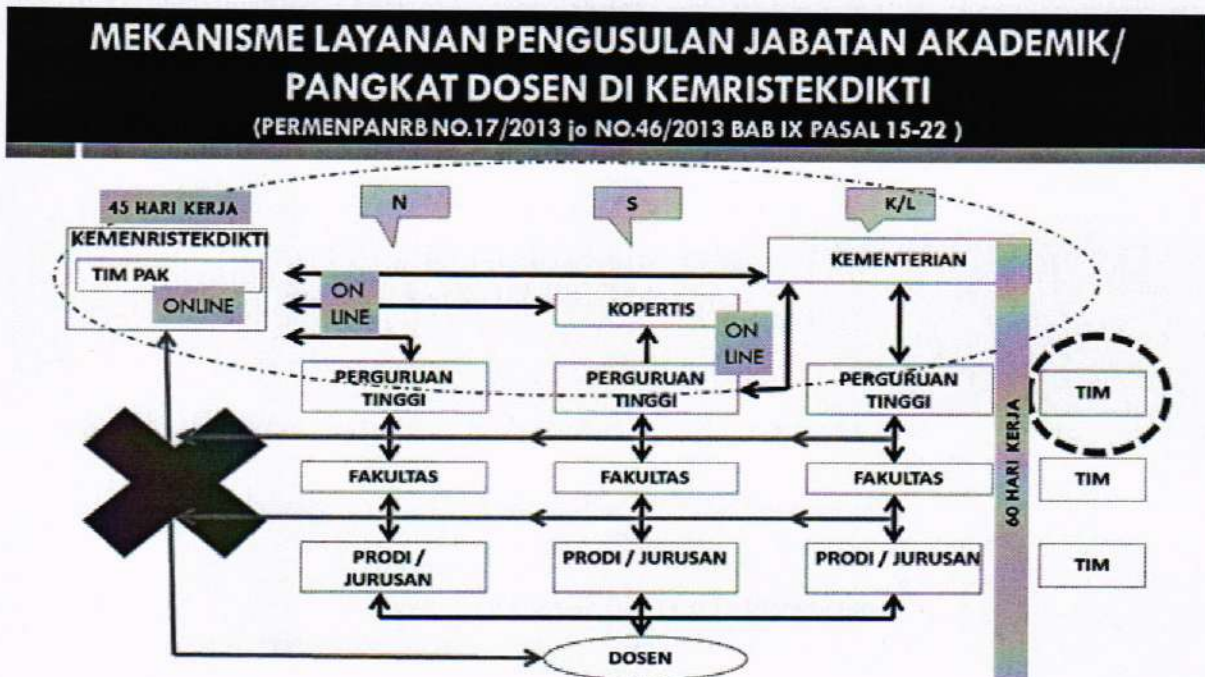
Gambar 1. Mekanisme Layanan Pengusulan Jabatan Akademik/Pangkat Dosen

Kenaikan jabatan akademik/pangkat dosen merupakan bagian tidak terpisahkan dengan pengembangan karir dosen, dengan demikian mekanisme penilaian dan proses kenaikan jabatan akademik/pangkat dosen akan diintegrasikan secara online (daring). Dengan sistem daring diharapkan dapat meningkatkan efisiensi layanan dan mendukung prinsip-prinsip penilaian, sebagaimana pada Gambar 1.